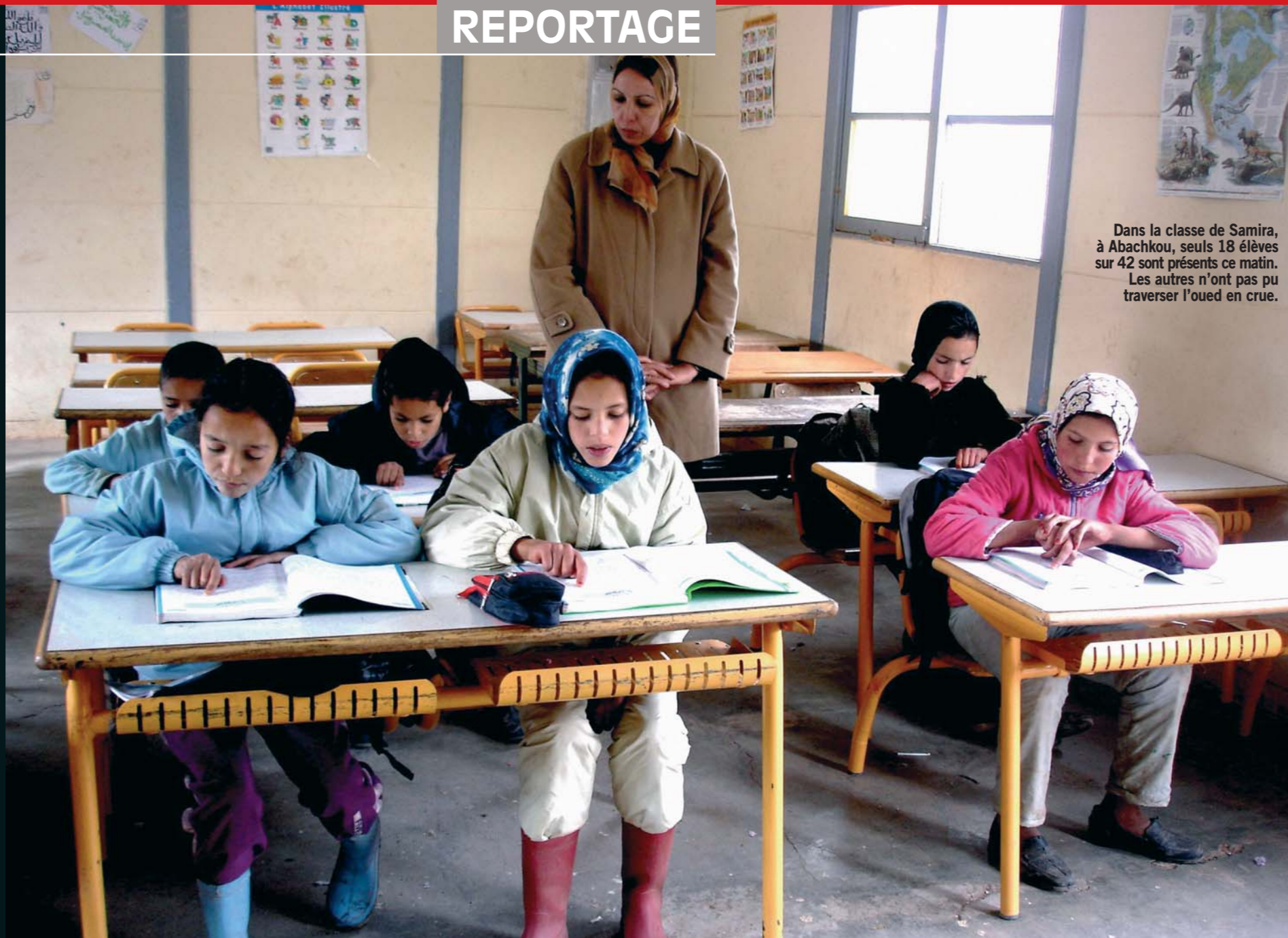
Dans la classe de Samira, à Abachkou, seuls 18 élèves sur 42 sont présents ce matin. Les autres n'ont pas pu traverser l'oued en crue.

TEXTE ET PHOTOS CERISE MARÉCHAUD, envoyée spéciale à Abachkou